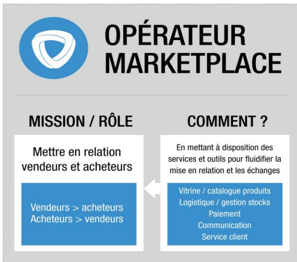
Modélisation du rôle de l'opérateur de Marketplace

Enfin, dernier aspect du métier de l'opérateur, le maintien de l'équilibre entre l'offre et la demande. La Marketplace doit être un lieu où les clients trouvent facilement ce qu'ils recherchent. C'est encore une fois grâce aux outils qu'il met en place sur son espace et à la qualité de sa plateforme technique que l'opérateur peut faire correspondre efficacement l'offre et la demande.